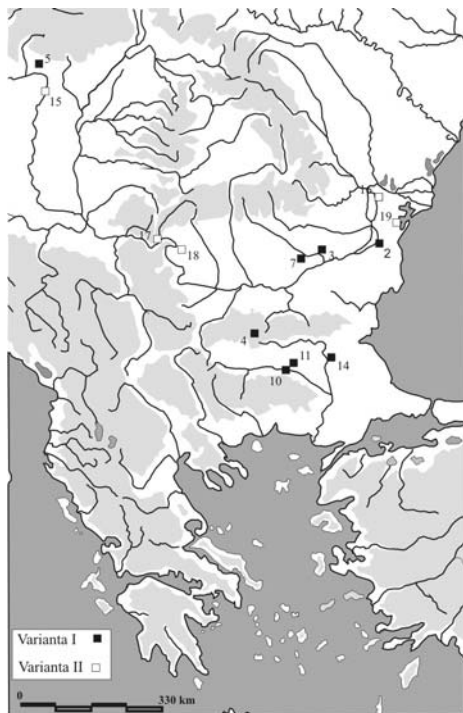
Fig. 2. Răspândirea topoarelor de tip Veselinovo