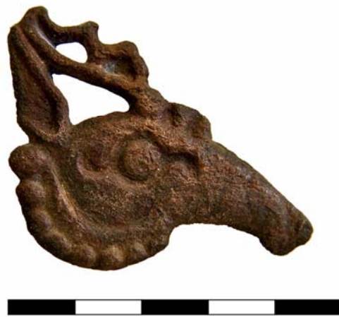
Fig. 1. Pièce de harnachement de la nécropole d'Histria